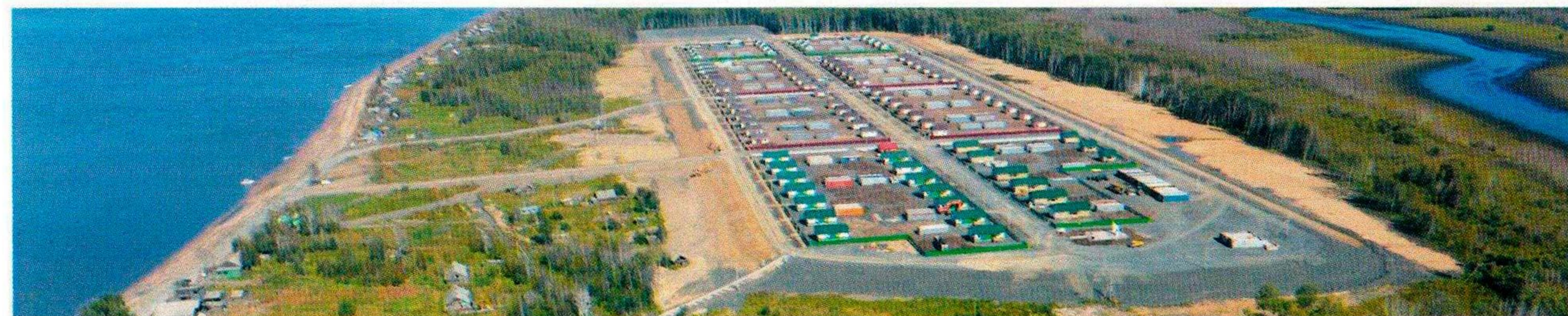
Инженерная защита от затопления с. Бельго Комсомольского муниципального района Хабаровского края

воздействий и течения. ООО «Дальгипроводхоз» проектировало и всю инженерную инфраструктуру нового поселка.