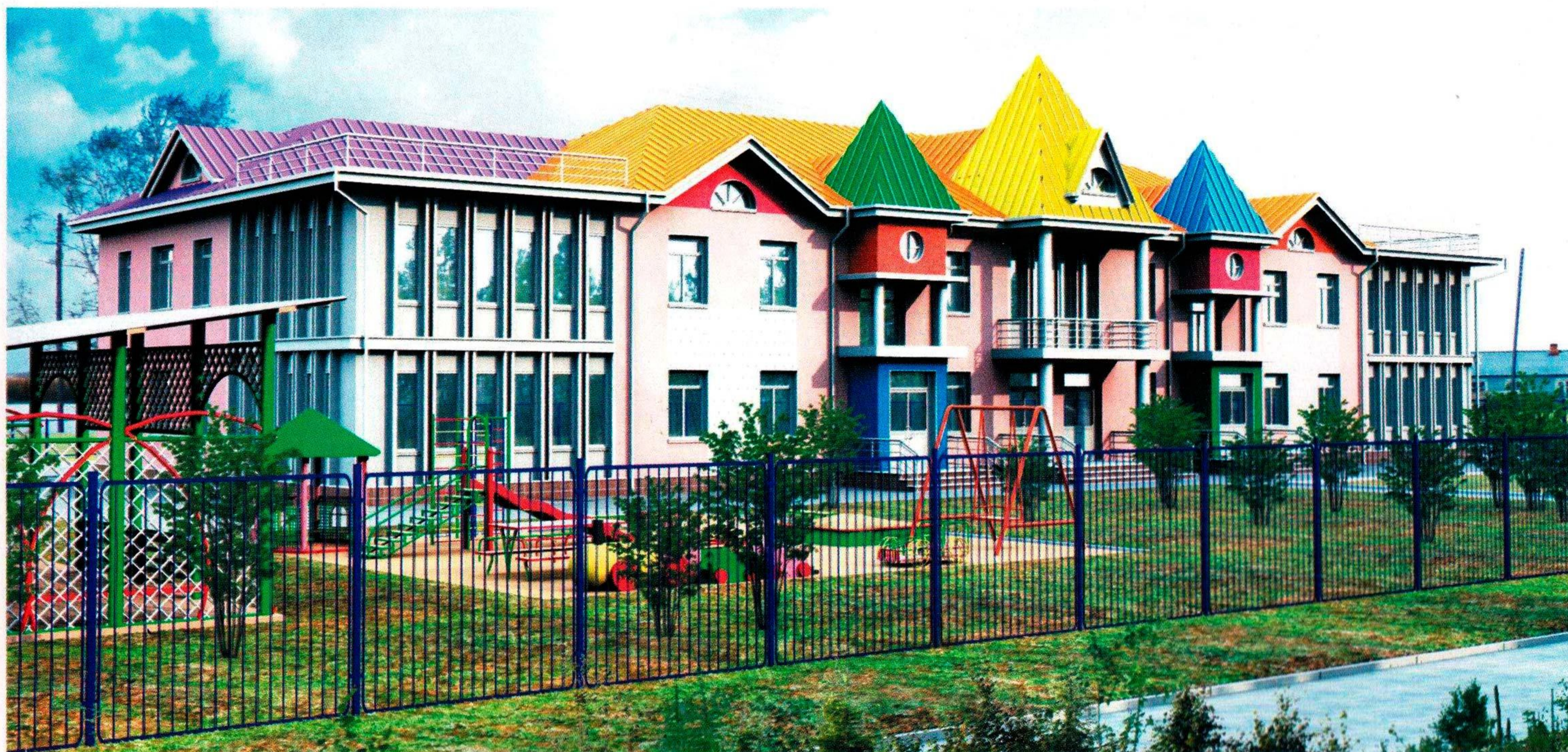
Детский сад на 55 мест в с. Дада Нанайского муниципального района Хабаровского края

Специалисты института запроектировали инженерную защиту села Бельго Комсомольского района. Поселок, полностью затопленный большой водой, решили не переносить на другое место, не расселять жителей в городские квартиры – для нанайцев, которые испокон веков живут в Бельго, это означало бы конец привычного жизненного уклада, смерть национальной культуры. Было решено построить для сельчан новые дома, предварительно отсыпав под них грунтовую площадку на незатопляемую отметку. Откосы площадки укреплены камнем для защиты от волновых